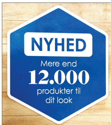
Figur 1. Reklame i Matas forretning. Op med humøret!

Tabel 1 viser eksempler på væsentlige miljøfremmede stoffer samt deres kilder. De klassiske miljøfremmede stoffer fra 1970'erne er de olierelaterede stoffer, detergenter samt